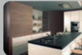
Bathrooms & Kitchens Salles de bain & cuisine