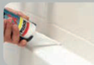
Sanitary joints Application sanitaire

For perfect results pour le résultat parfait